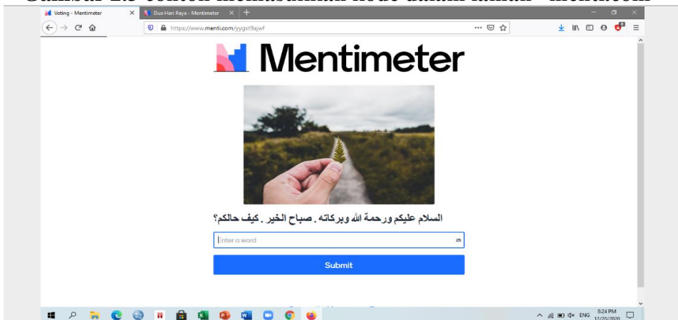
Gambar 2.3 contoh memasukkan kode dalam laman “menti.com”

Kemudian akan muncul tampilan awal materi yang sedang dipresentasikan oleh guru. Dan siswa dapat secara langsung mengikuti proses pembelajaran.