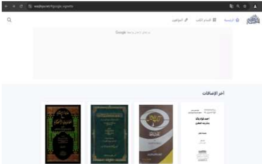
Gambar 1. Tampilan situs Waqfeya

Website yang beralamat https://waqfeya.net/ merupakan situs berbahasa arab yang memiliki ribuan koleksi kitab berbahasa arab, baik klasik maupun kontemporer. 20 Dalam situs ini para pembaca bisa mengunduh kitab apapun yang diinginkan dengan cara mengetik apa yang hendak dicari kemudian kita bisa mencari dengan memilih pada kolom dengan judul kitab, nama pengarang, nama muhaqiq , ataupun pencarian umum. Setelah menemukan kitab, kita akan diarahkan ke halaman berikutnya untuk mengunduh kitab tersebut dan muncul gambar sampul kitab yang kita pilih. Oleh karena situs waqfeya men- scan kitab yang sudah dicetak oleh penerbit kemudian menformatnya dalam bentuk PDF, maka kitab dalam bentuk softfile memiliki tampilan dan isi yang sesuai dengan aslinya (versi hardfile atau cetak). Di bawah gambar sampul kitab ada sedikit penjelasan mengenai kitab tersebut, meliputi judul kitab secara lengkap, nama pengarang, nama muhaqqiq bila ada, penerbit, tahun terbit, jumlah