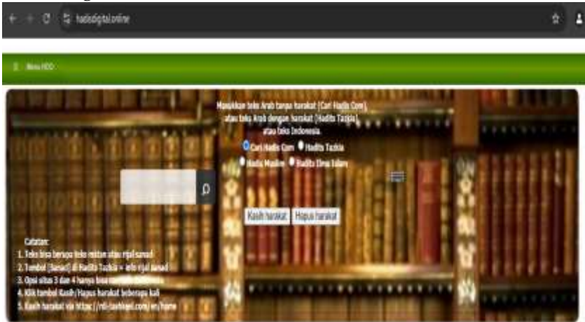
Gambar 4. Tampilan situs Hadis Digital Online All in One

Situs hadis digital online all in one ini https://www.hadisdigital.online/ merupakan situs milik dari UIN Banten yang dirancang untuk membaca, mencari dan mengunduh hal-hal yang berkaitan dengan hadis digital dari berbagai website hadis, baik untuk keperluan akademik maupun non-akademik.