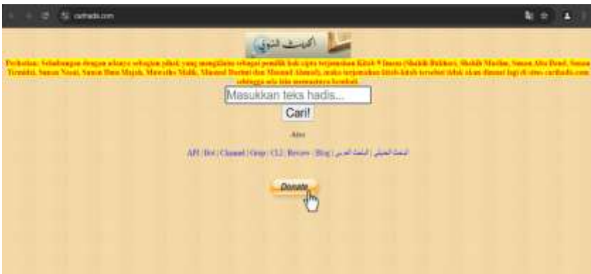
Gambar 3. Tampilan situs CariHadis.com

Situs carihadis.com https://carihadis.com/ merupakan situs pencari hadis yang lengkap. 24 Cara kerja dari situs ini sangatlah simple kita cuma hanya memasukkan nomor hadis ataupun kata kunci, setelah itu muncullah hadis-hadis yang berkaitan dengan yang mau dicari dari berbagai kitab serta terjemahan Bahasa Indonesia. Dalam situs ini juga ditampilkan