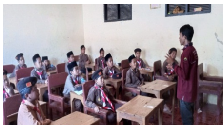
Gambar 2: Praktik di kelas

Memberikan beberapa arahan terhadap peserta didik ketika mempraktikkan membaca berita dengan menggunakan media Elegan Telepromter merupakan langkah terakhir dalam tahapan pelaksanaan dimana peserta didik diberi arahan untuk mengikuti naskah/narasi yang sudah tersedia baik itu dalam segi intonasi, kefokuskan dan cara berhenti pada titik dan koma.