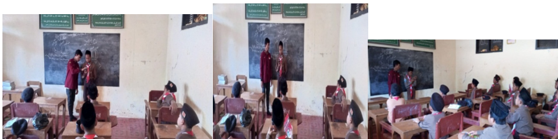
Gambar 3: Praktik di kelas

Mempraktikkan Elegan Telepromter setelah menjelaskan penggunaannya terhadap peserta didik merupakan langkah selanjutnya dalam tahapan pelaksanaan. Pada langkah ini peneliti membacakan teks berita dengan menggunakan Elegan Telepromter setelah itu meminta beberapa orang dari peserta didik maju ke depan untuk mempraktikkan membaca teks berita menggunakan Elegan Telepromter.