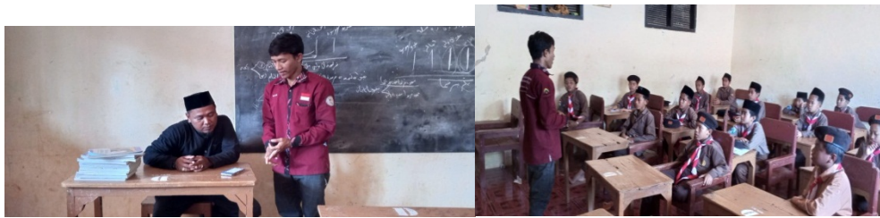
Gambar 2: Pelaksanaan di kelas

Penjelasan penggunaan Elegan Telepromter merupakan langkah pertama dalam tahapan pelaksanaan dimana peneliti menjelaskan terhadap peserta didik apa itu Elegan Telepromter, manfaat, cara mendapatkan/mendownload, cara mengoperasikan dan kaitannya dengan membaca teks berita .