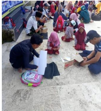
Gambar 3 Penggunaan Media Untuk Pembelajaran Sumber: dokumentasi lapangan (2024)

UDL merupakan suatu pendekatan dalam merancang metode pembelajaran untuk membantu anak berkebutuhan khusus yang disesuaikan dengan kemampuannya. Hal tersebut sependapat dengan (Rosalina Afdalipah, S. Sumihatul Ummah, n.d.) bahwa UBL mendukung pembelajaran yang dapat diakses secara luas mengenai aktivitas pembelajaran yang disesuaikan dengan kemampuan individu anak usia dini. Pendekatan UDL meliputi bahan cetak, konten digital, bahan ajar visual dan video. Bentuk pendekatan intervensi terdiri dari penyampaian materi pembelajaran baik secara visual maupun akustik dengan bantuan media, berkomunikasi dengan bantuan media, menarik perhatian anak berkebutuhan khusus. Penilaian dilihat dari cara berkomunikasi maupun hasil karya. Berikut dokumentasi penggunaan media untuk menarik perhatian anak berkebutuhan khusus untuk merangsang berbicara.