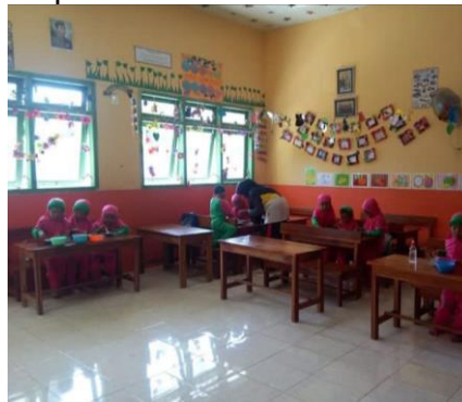
Gambar 5 Dokumentasi penerapan posisi bangku Sumber: dokumentasi lapangan (2024)

Fokus pembelajaran TEACCH adalah pada praktik komunikasi melalui keterampilan visual anak autis. Seperti ungkapan (Sudarto et al., 2019) bahwa metode TEACCH merupakan metode untuk keterampilan berkomunikasi dan sosial pada anak autis yang mengalami kesulitan belajar melewati gambar secara visual. Artinya, pembelajarannya memasukkan sesuatu yang berhubungan dengan gambar minat anak-anak. Sehingga pembelajaran anak mendapatkan instruksi yang divisualisasikan melalui gambar. Dalam penerapannya posisi bangku anak ABK harus diletakkan di depan sendiri. Dokumentasi penerapan posisi bangku untuk anak ABK yang didepan dan diberikan perhatian khusus.