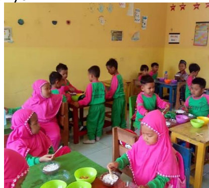
Gambar 6 Dokumentasi Pembelajaran Interaksi Sosial Yang Berkelanjutan

Pendekatan pembelajaran ABA diterapkan pada anak autis dengan menekankan peran guru dalam mengajar, membimbing dan membantu siswa. Menurut (Prasetyoningsih, 2020) metode ABA dilakukan dengan cara mengajarkan perilaku dasar melalui pemberian stimulus yang tepat, tuntas, konsisten, dan berkelanjutan. Dalam penerapannya, ada penekanan pada guru berinteraksi lebih aktif dengan siswa sehingga siswa dapat belajar menanggapi apa yang diterimanya. Dalam pembelajaran ini sangat menekankan perilaku anak perlu dirubah dengan menganalisis perilaku dalam interaksi sosial. Berikut dokumentasi pembelajaran interaksi sosial dengan teman kelasnya.