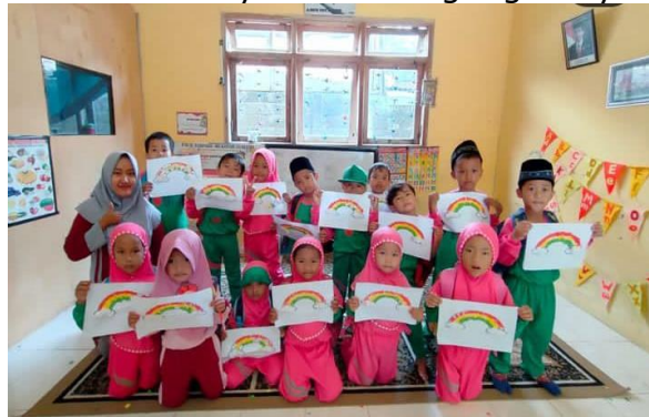
Gambar 1 Dokumentasi Pembelajaran Mewarnai

Intervensi biasanya berupa pendidikan untuk anak di bawah usia 3 dan 5 tahun dan layanan terkait, yang meliputi pendidikan, nutrisi, pengasuhan anak, dan dukungan pengasuhan. Hal tersebut sesuai dengan (Taqiyah, 2022) bahwa intervensi anak usia dini mengacu pada pendidikan dan layanan anak prasekolah dari usia 3 sampai 5 tahun. Semua bagian ini dirancang untuk mendobrak hambatan atau mencegah masalah dalam pembelajaran dan perkembangan bahasa bagi anak berkebutuhan khusus. Namun, secara faktual tindakan intervensi perlu diterapkan sejak dini. Misalkan dalam jenjang pembelajaran di Paud. Seperti di PAUD Mukhtar Syafaat yang memiliki siswa ABK. Dengan permasalahan siswa ABK enggan berkomunikasi yang disebabkan oleh beberapa faktor. Hal ini tentu menjadi kendala bagi perkembangannya. Tindakan tersebut tentunya sesuai dengan permasalahan yang ada. Karena, intervensi merupakan layanan yang dilaksanakan untuk anak-anak yang membutuhkan pendidikan khusus dan layanan terkait untuk meminimalkan keterlambatan perkembangan mereka secara berkelanjutan(Martony, 2023). Berikut suasana kegiatan pembelajaran di PAUD Mukhtar Syafaat Blokagung Banyuwangi.