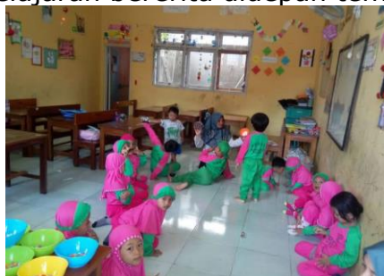
Gambar 4 Dokumentasi Pembelajaran Bercerita

Montessori adalah metode yang membantu setiap anak mencapai potensinya di semua bidang. Selain itu, menurut (Permataputri & Syamsudin, 2022) dapat diartikan sebagai menciptakan potensi diri dengan maksimal melalui pencapaian proses pembelajaran pada bidang probadi yang unik. Salah satunya kemampuan berbahasa. Pengaplikasiannya anak dilatih untuk berkomunikasi dihadapan orang banyak dengan meminta anak untuk bercerita tentang apa yang menarik atau pengalaman liburan. Berikut dokumentasi pembelajaran bercerita didepan teman-temannya.