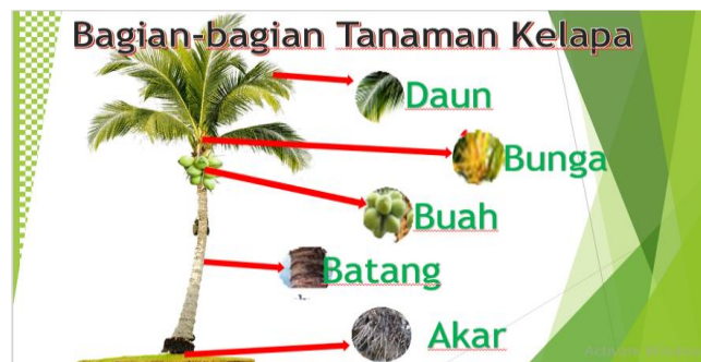
Gambar 1.2 bagian-bagian tanaman kelapa

mengembangkan aspek kognitif, bahasa serta sosial emosional pada tahapan pertama pembelajaran tersebut.