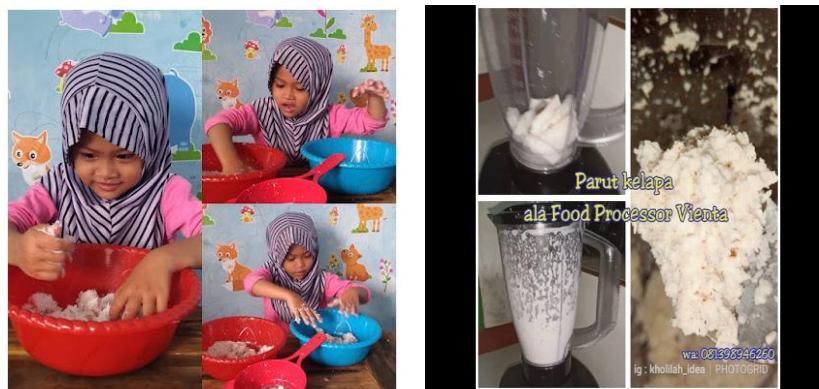
Gambar 1.4 Memeras Parutan Kelapa

Guru memberikan contoh dengan mendemonstrasikan terlebih dahulu kepada anak kemudian memberikan kesempatan kepada anak untuk mencobanya sendiri. Kesempatan yang diberikan kepada anak akan menstimulasi kognitifnya berkembang dan anak menjadi lebih percaya diri.