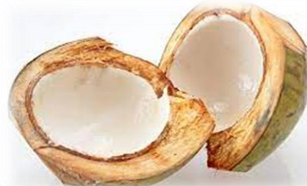
Gambar 1.3 penataan media kegiatan membuat es kelapa muda segar

Kegiatan membuat es kelapa muda diawali dengan gerakan motoric halus anak dengan cara menghaluskan dan meremas kelapa, hal ini melibatkan gerakan otot tangan anak yang dapat memberikan stimulasi pengembangan aspek motorik halus anak berkembang dengan optimal. Selain itu kegiatan meremas serta menghaluskan kelapa bertujuan memberikan pengalaman belajar secara nyata pada anak terkait cara ataupun teknik yang tepat dalam menghaluskan dan memeras kelapa dengan benar. Prosedur yang dilalui adalah guru menjelaskan bagaimana cara memeras parutan kelapa dan menghaluskan kelapa menggunakan blender.