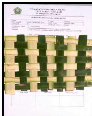
Gambar 1.6 LKPD Anyaman

Materi kegiatan kelima, yaitu menciptakan karya seni anyaman daun kelapa dengan tujuan anak didik dapat terampil menggunakan tangan kanan – kirinya menganyam daun kelapa pada LKPD. Prosedur guru menjelaskan cara menganyam yang rapi dan mengikuti pola pada LKPD.