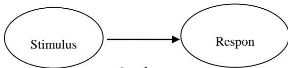
Gambar 2.1 Model Stimulus Respons (S-R)