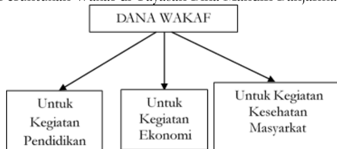
Gambar 2 Peruntukan Wakaf di Yayasan Bina Mandiri Banjarmasin

Pada saat ini hasil pengelolaan wakaf produktif di yayasan belum pernah digunakan untuk kegiatan bantuan kepada fakir miskin, anak terlantar dan kemajuan perekonomian masyarakat sekitar, Akan tetapi bantuan beasiswa bagi siswa kurang mampu menggunakan dana BOS dan bantuan ekonomi bagi warga sekitar yang memerlukan menggunakan dana sumbangan dari kelas yang dikumpulkan tiap tahun. Hal ini seperti yang disampaikan pembina yayasan H. Rusydi Rusli, beliau mengatakan bahwa: